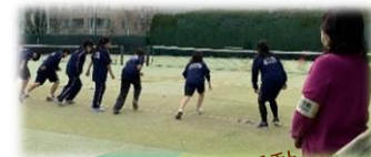
部活動の見守り活動