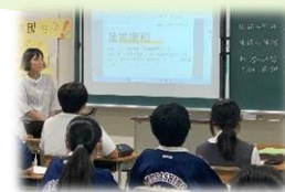
キャリア教育の ゲストティーチャー

地域コーディネーターを配置することで、地域の参画による多様な地域学校協働活動が推進されています。 『地域の教育力』事業を活用した諸活動、登下校・部活動の見守りや、授業、行事や課外活動支援など様々なものがあります。