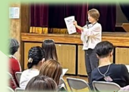
ボランティア募集案内