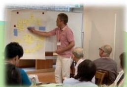
出合った意見の共有

子どもの育ちや求められる学校の姿を様々な視点で話し合うことで、 #地域とのつながり を生かした教育活動も豊かになります。